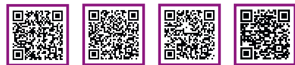
Casas rurales Hospederías Albergues Turismo activo

Disfruta de la naturaleza y alójate en las casas rurales, hospederías y albergues que ofrece el término municipal de Lorca.